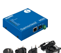
Damocles2 MINI set

12× DI, 8× DO OC, včetně napájecího adaptéru