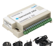
Damocles2 2404 set

24× DI, 4× DO relé, včetně napájecího adaptéru