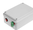
Back-Up UPS Lite