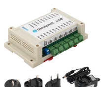
Damocles2 1208 set

24× DI, 4× DO relé, včetně napájecího adaptéru