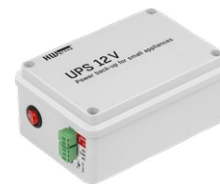
Back-Up UPS 12V Zálohovaný napájecí zdroj. 12 V, 1,3 Ah.