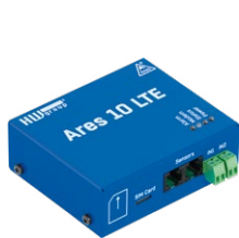
Ares 10 LTE plain Jednotka Ares 10 LTE plain bez příslušenství.