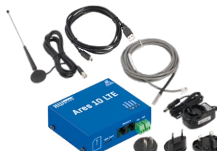
Ares 10 LTE Tset Startovací balení Ares 10 LTE s teplotním čidlem, napájecím adaptérem, externí anténou, kabelem USB.