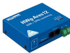
HWg-Ares 12 plain Jednotka Ares 12 plain bez příslušenství.