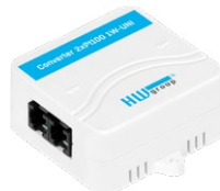
Converter 2xPt100 1W-UNI Dvojitý převodník pro teplotní čidla Pt-100 a Pt-1000.